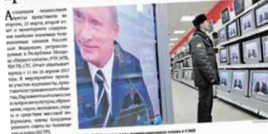
АНП, АНПМ и другие органы власти в Кишиневе